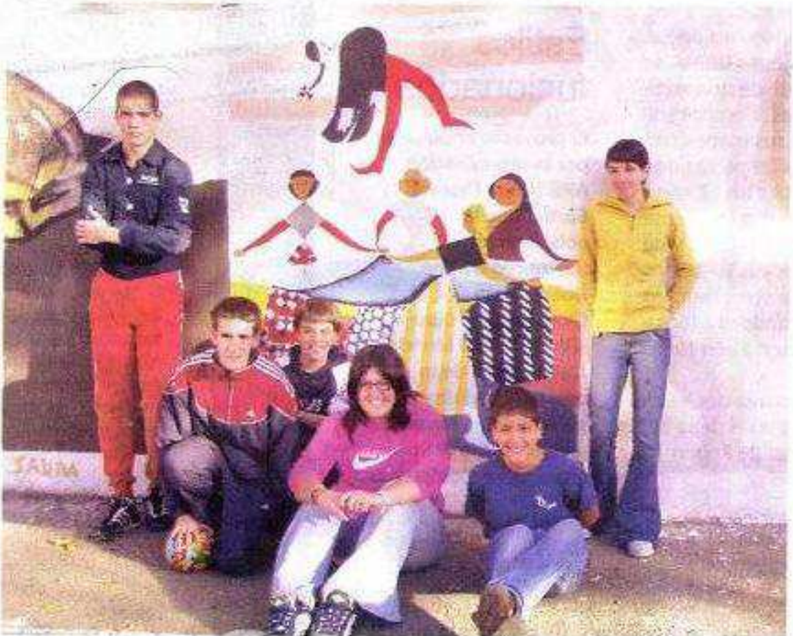
►► El patio del centro toma así un colorido especial, repleto de cultura.