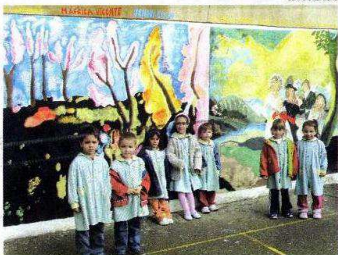
►► Para evitar la erosión de la obra se aplicó un barniz especial al muro.