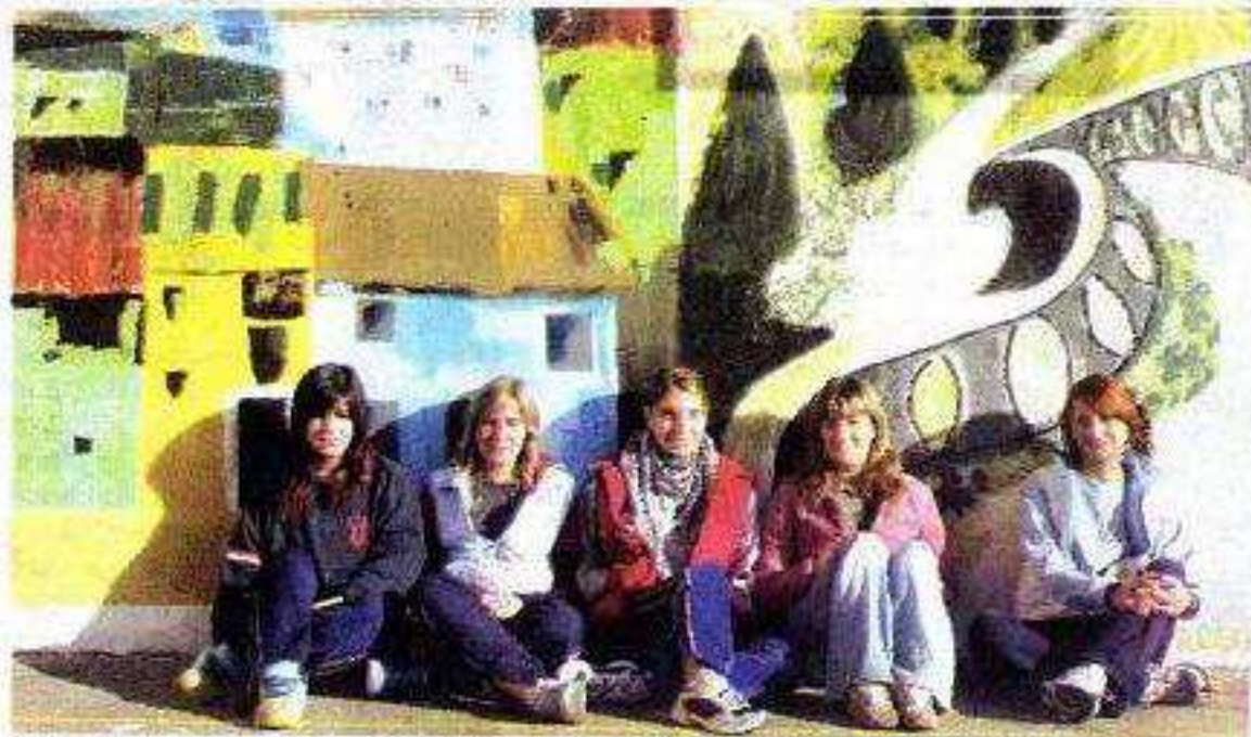
►► Los murales son copias fieles a los originales, algunos son adaptaciones.