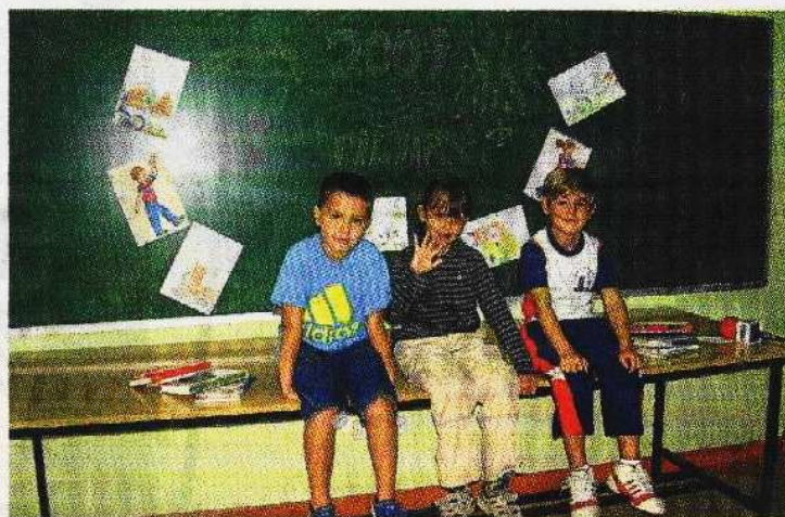
■ Tres de los pequeños artistas, en su clase.